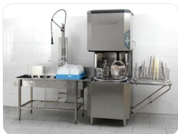
Lungo in muro

Grazie al design con la caratteristica cappa, la macchina può essere collocata praticamente ovunque nella cucina, persino in un angolo o lungo un muro. Per usare il sistema nel modo più efficiente, ti consigliamo di usare i banchi di ingresso e di uscita che permettono di sfruttare due cestini e lavare il contenuto di un cestino mentre si riempie o si svuota l'altro.