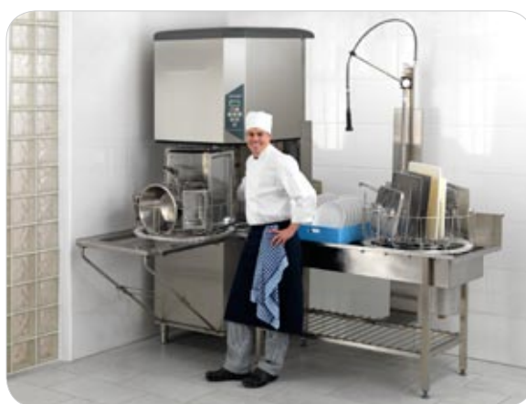
In un angolo